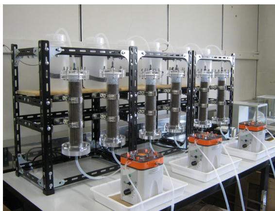
図－2 カラム試験の写真