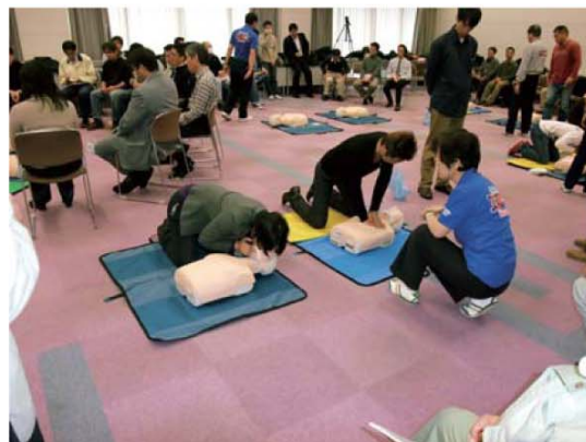
普通救命講習状況